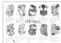
全体のデザインが分かるように表現

自分がデザインして付けてみたいと思う「ネイル」を、自由楽しく考えて表現してみてください。