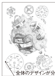
全体のデザインが分かるように表現

自分がデザインして住んでみたいと思う「家」を、自由楽しく考えて表現してみてください。