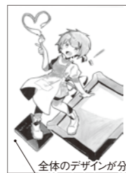
全体のデザインが分かるように表現

自分がデザインしてみたい「キャラクター」を、自由楽しく考えて表現してみてください。